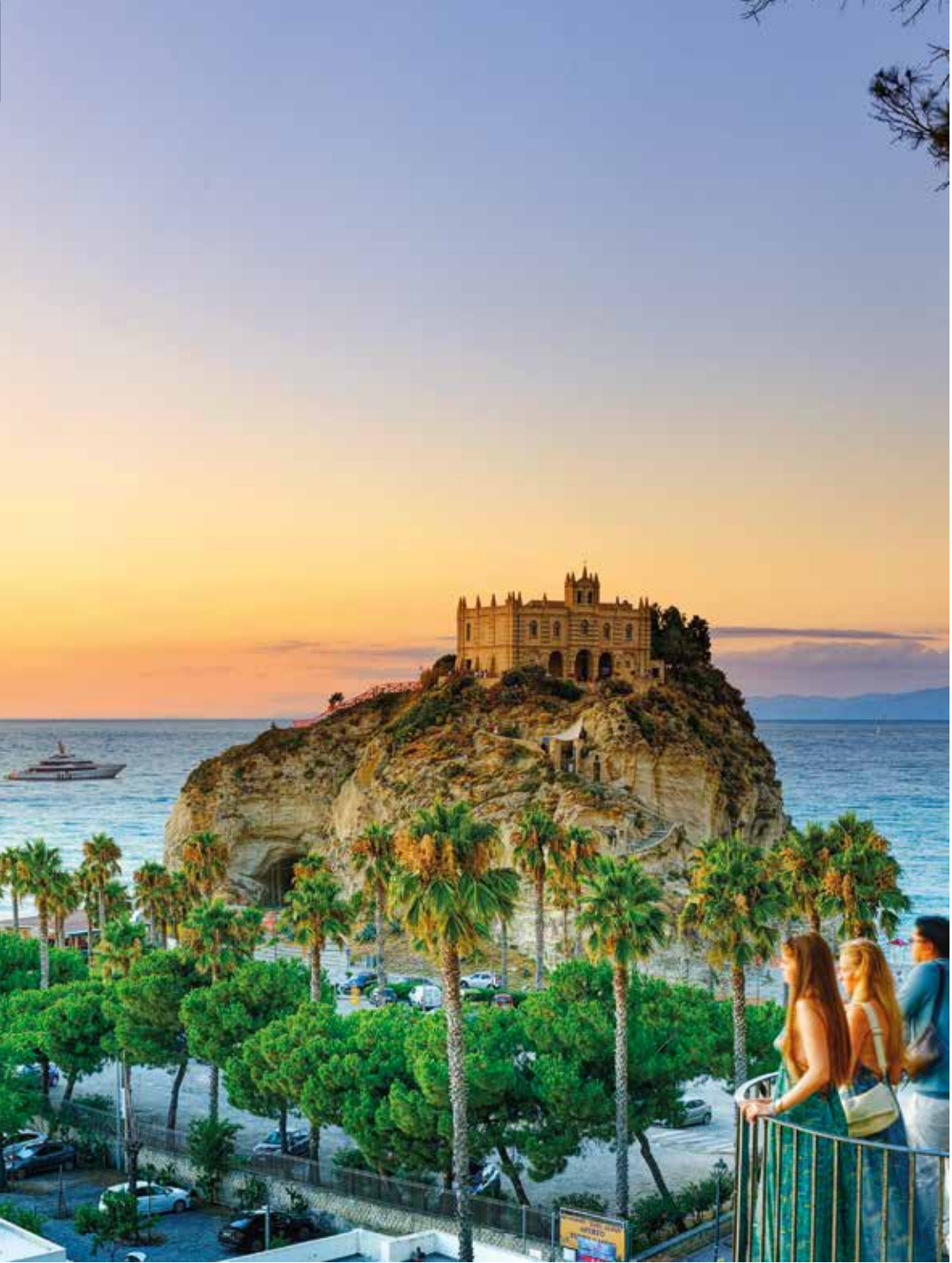
Farbenspiel über Tropea – ein stimmungsvoller Abschiedsgruß Kalabriens