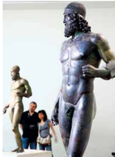
Bronzestatuen von Riace