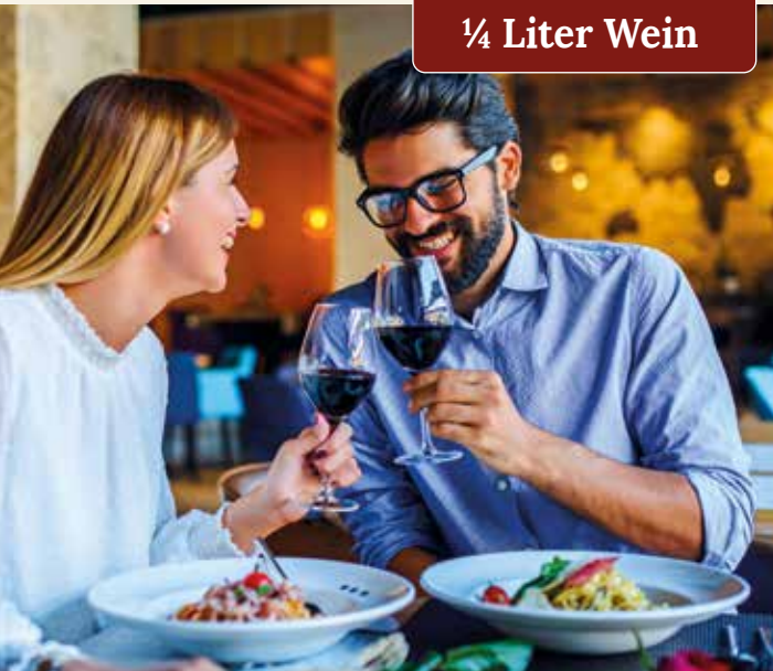
Kulinarischer Genuss in entspannter Atmosphäre

HALBPENSION Abendbuffet mit ¼ Liter Wein