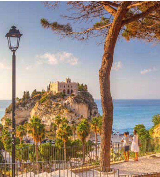
Panoramablick auf die Kathedrale von Tropea