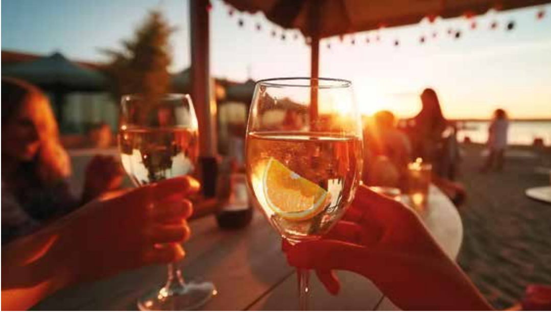
Meerblick und Abendsonne – ein idealer Abschluss des Tages