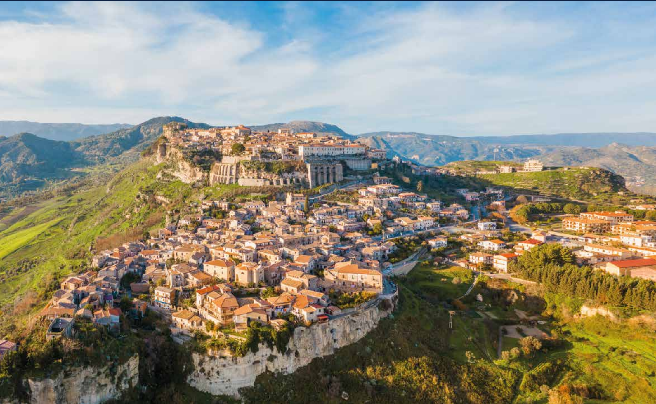
Blick aus dem Umland auf die wundervolle Altstadt von Gerace