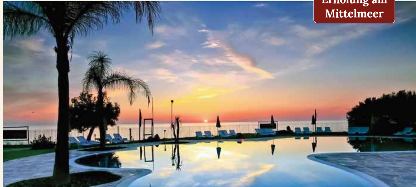
Traumhafte Kulisse für entspannte Urlaubsabende