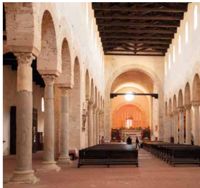
Griechische Kolonnade in der Kathedrale