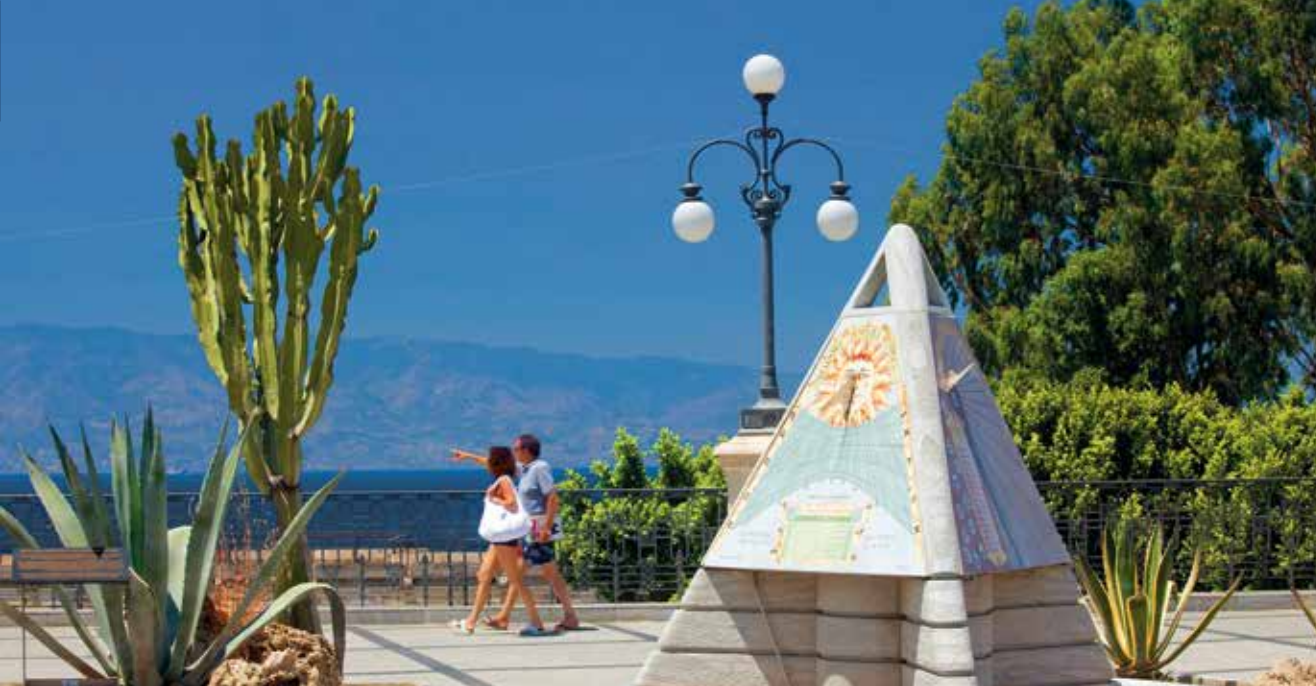
Reggio Calabrias Uferpromenade ist als der schönste Kilometer Italiens bekannt