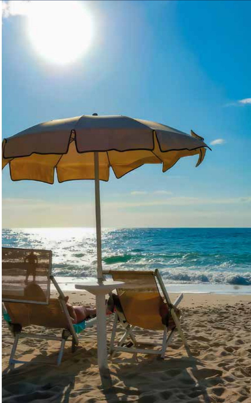
Zeit für einen Tag am Meer zum Entspannen

Wir genießen ein Abschiedsfrühstück in unserer Ferienanlage, bevor der gemeinsame Transfer zum Flughafen erfolgt. Die Fahrt bietet Gelegenheit für letzte Gespräche und den Abschied von lieb gewonnenen Reisebekanntschaften. So endet die Reise ebenso entspannt und sorgfältig begleitet, wie sie begonnen hat.