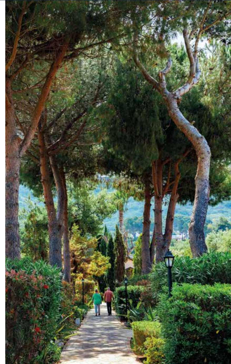
Mediterranes Grün prägt das Ambiente unserer Ferienanlage