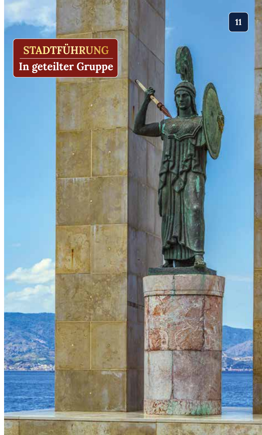
Die Athene-Statue an der Straße von Messina