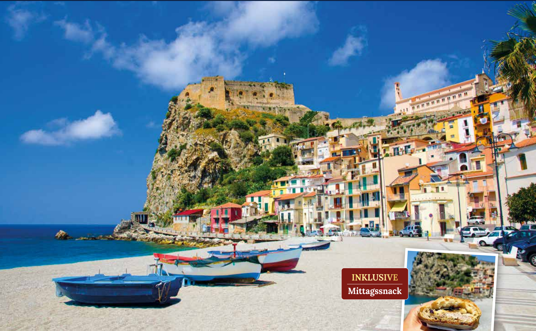
An der bunten Strandpromenade von Scilla genießen wir ein Schwertfisch-Panino, ein authentisches Streetfood