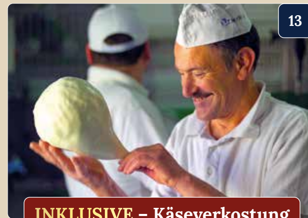
INKLUSIVE – Käseverkostung

Der Caciocavallo ist ein regionaler Käse Süditaliens mit antiken Ursprüngen. Bereits mehrere Jahrhunderte vor Christus wurde er in historischen Quellen erwähnt und zählt bis heute zu den bekanntesten Spezialitäten Kalabriens. Auf einem Landwirtschaftshof werfen wir einen Blick in die traditionelle Käseproduktion und erfahren mehr über die besondere Herstellung dieser regionalen Spezialität, die bis heute nach überlieferten Methoden gefertigt wird.