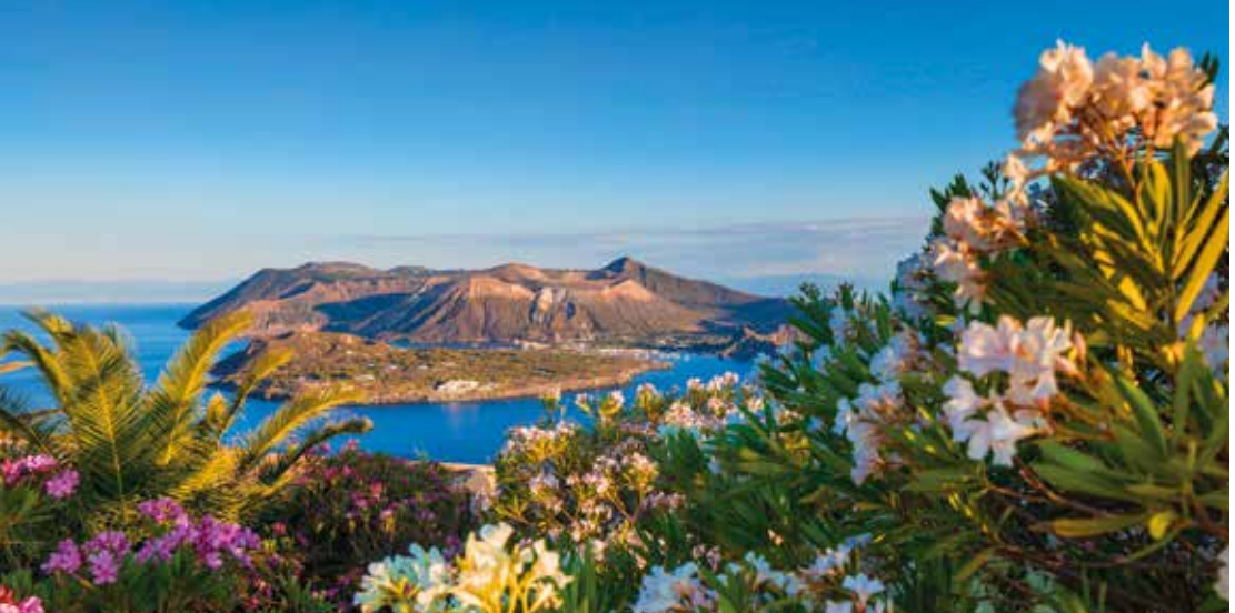
Panoramablick von Lipari aus auf die Insel Vulcano