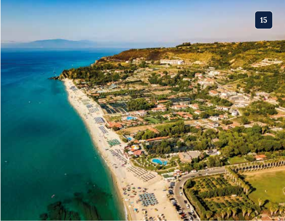
Ein letzter Blick auf Kalabriens berühmte Küste der Götter