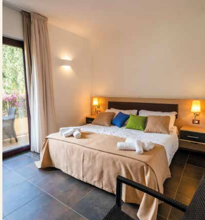
Schlicht und gemütlich – unsere Zimmer