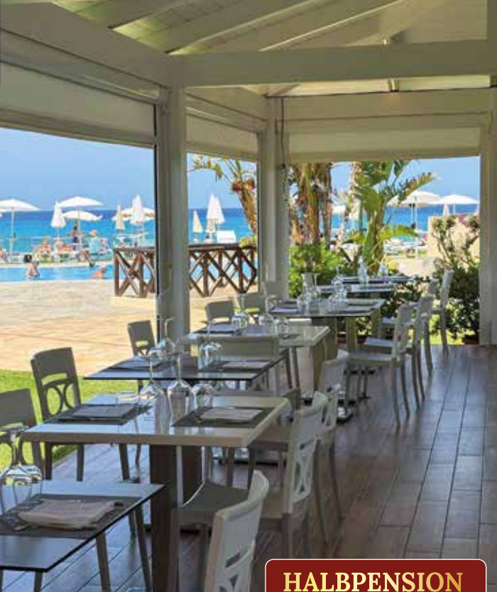
Restaurant mit Terrasse

HALBPENSION Abendbuffet mit ¼ Liter Wein