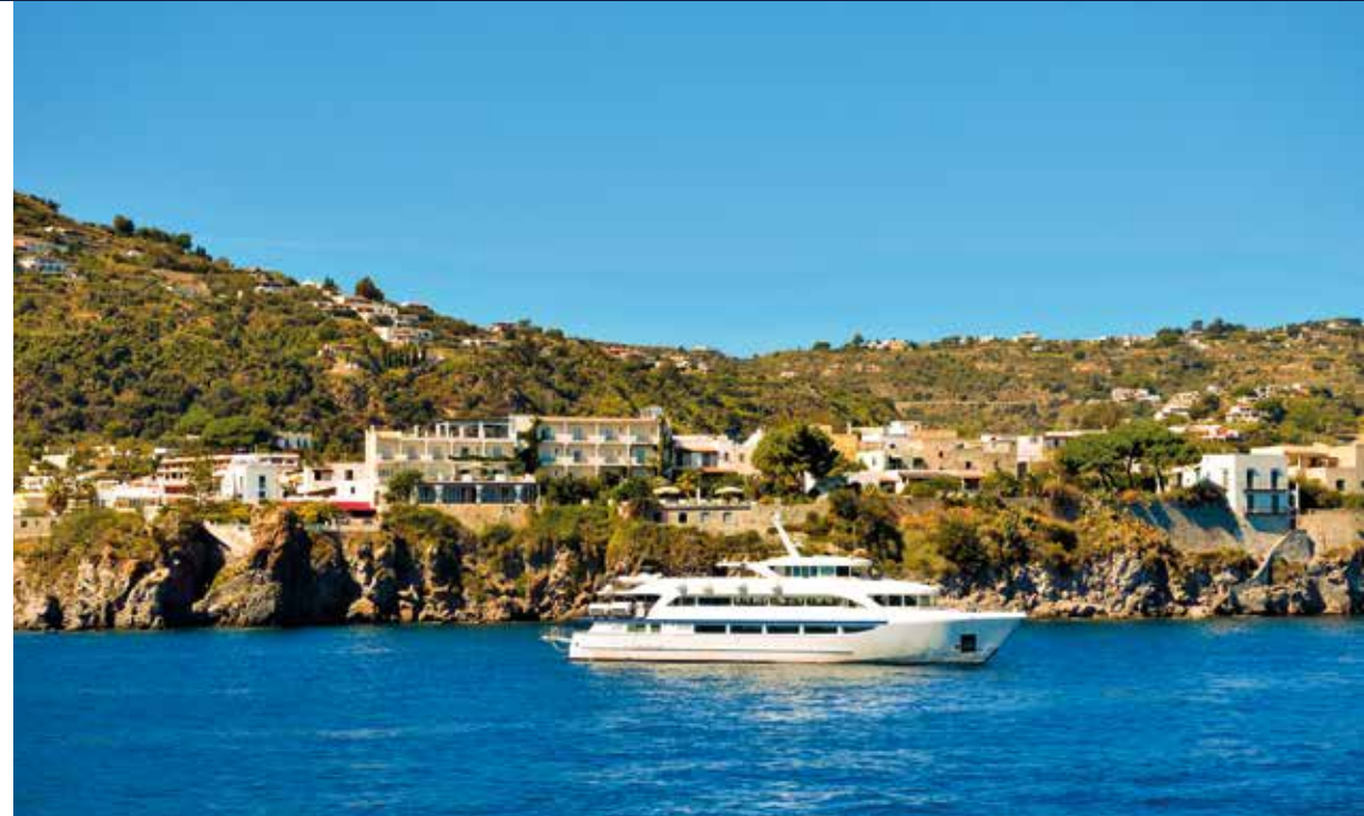
Inklusive Schifffahrt zu den Liparischen Inseln – Beispielfoto. „Die sieben Schönen“, wie sie von den Italienern liebevoll genannt werden, liegen vor der Küste Siziliens