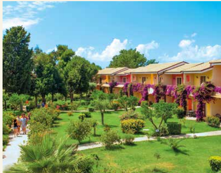
Ferienidylle im mediterranen Garten