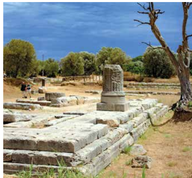
Locri, Geschichte unter freiem Himmel

Gerace zählt zu den schönsten mittelalterlichen Orten Kalabriens. Mit dem kleinen Touristenzug fahren wir durch die Gassen hinauf in die historische Altstadt. Gegründet wurde der Ort im 10. Jahrhundert von Bewohnern der antiken Küstenstadt Locri, die sich vor Überfällen ins geschützte Hinterland zurückzogen. Noch heute prägen historische Palazzi und die imposante Kathedrale das Stadtbild. Sie gilt als eines der