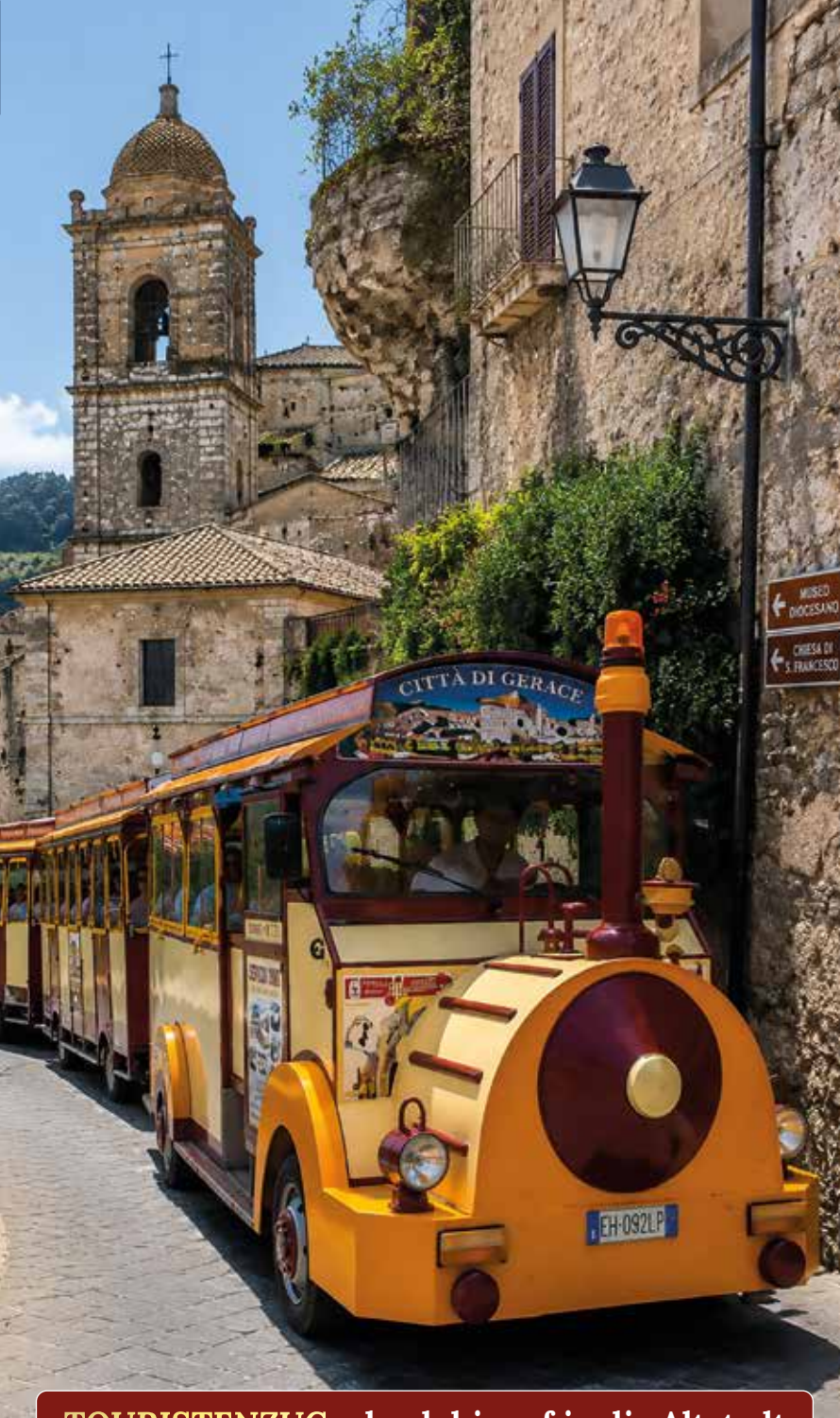
TOURISTENZUG – hoch hinauf in die Altstadt