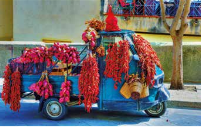
Tropea-Zwiebel & Peperoncino Fester Bestandteil der kalabrischen Küche sind Peperoncini, die im 16. Jahrhundert aus Amerika nach Kalabrien gebracht wurden, und die rote Zwiebel aus Tropea, die vor etwa 2.000 Jahren von den Phöniziern eingeführt wurde.