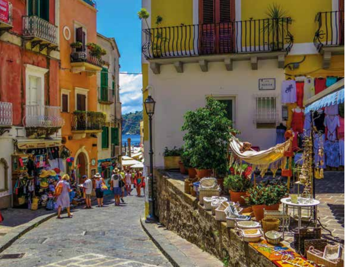
Bei einem Spaziergang durch das charmante Lipari lässt sich die entschleunigte Inselatmosphäre mit allen Sinnen aufnehmen