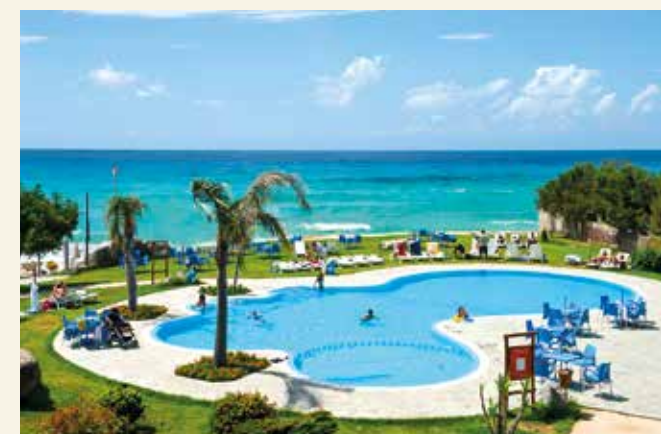
Urlaubszeit zwischen Pool, Palmen und Meer

Booking.com: „Sehr gut“, Stand: Juni 2026