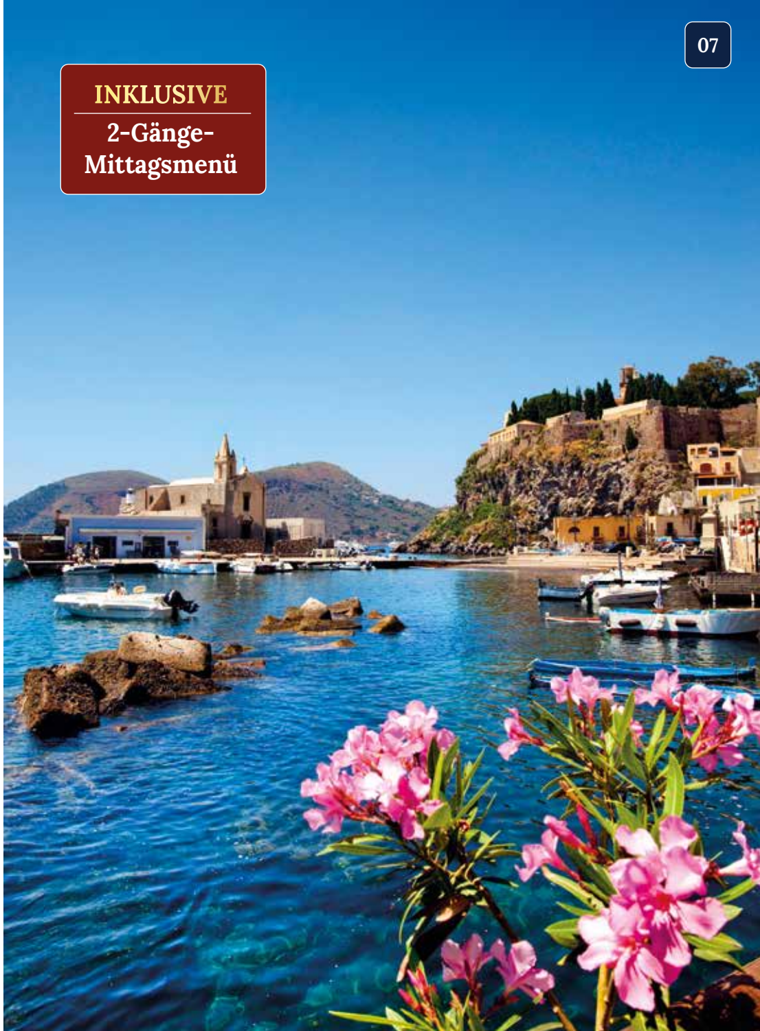
Lipari wird vom Burgfelsen und der spanischen Festung dominiert