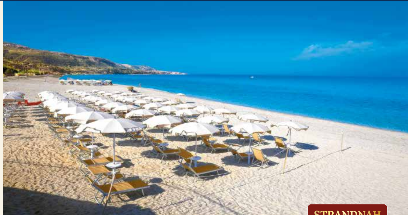
Der hoteleigene Strandabschnitt lädt zum Sonnenbaden ein

Teilen Sie Ihre Humboldt ReiseWelt-Erfahrung Ob Reise, Event oder Service: Ihre Eindrücke helfen anderen Gästen – und uns in der Weiterentwicklung.