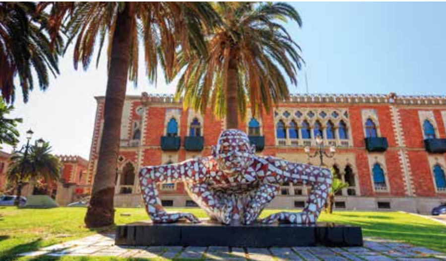
Eine von drei bunten Rabarama-Statuen an der Promenade